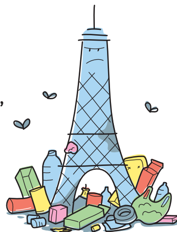
Réponse : cent tours Eiffel

Chaque année, en France, un million de tonnes de déchets sont ABANDONNÉS. Selon toi, est-ce le poids d'une tour Eiffel, de dix tours Eiffel ou de cent tours Eiffel ?