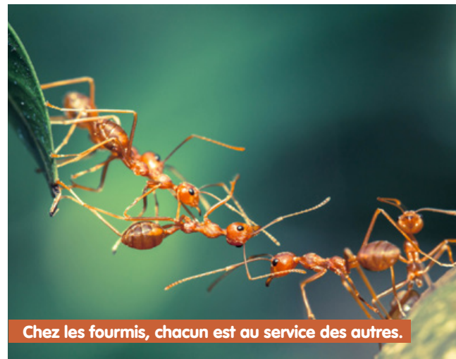
Chez les fourmis, chacun est au service des autres.

La fourmilière est un bel exemple de communauté. Chaque individu existe pour ce qu'il apporte aux autres. Ouvrières, soldats, nourricières... chacun a son travail.