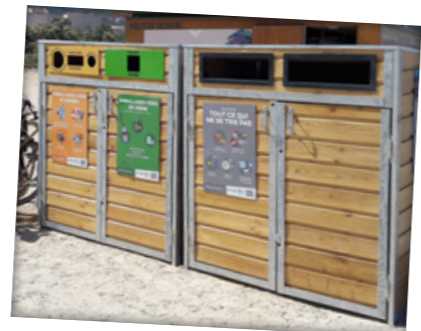
Marseille, Bouches-du-Rhône (13)