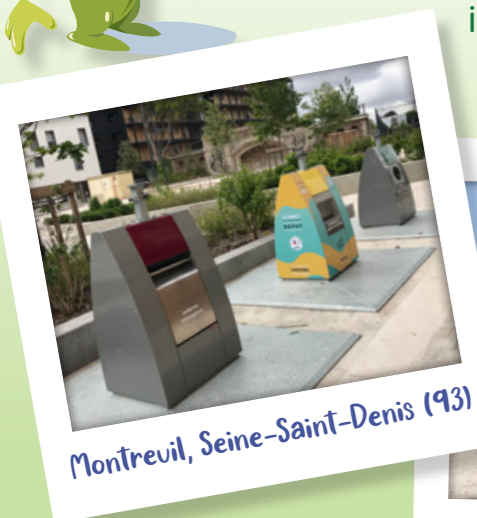
Montreuil, Seine-Saint-Denis (93)

Les bacs et conteneurs destinés au tri peuvent avoir des formes différentes selon les villes. L'important c'est qu'il y a toujours des indications dessus pour savoir quoi y mettre et comment bien trier. Si tu regardes bien, il y a toujours des images ou des textes pour t'aider à savoir ce que tu peux mettre ou ne pas mettre dans chaque conteneur.