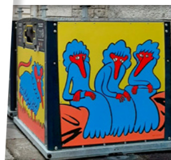
Besançon, Doubs (25)