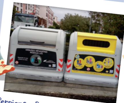
Perpignan, Pyrénées-Orientales (66)