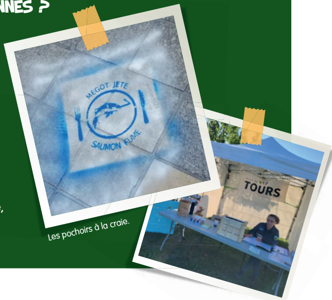
Les pochoirs à la craie.

● En mars de l'année dernière, nous avons également organisé un "Clean-up Walk" (en Anglais, une marche de nettoyage) qui a rassemblé 200 personnes pour ramasser des mégots de cigarettes à travers la ville. En 2 heures, nous en avons récolté 34 kg ! Nous avons recommencé 8 mois plus tard, et à notre grande surprise, il y en avait 2 fois moins : seulement 17 kg. Le message d'utiliser les cendriers est bien passé !